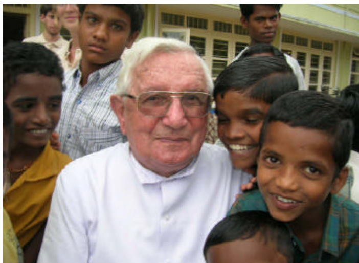
Les enfants du Yellagiri avec Le Père en Juillet 05

Un an déjà est passé après la catastrophe du Tsunami et la vie a repris le dessus partout en Inde presque comme si de rien n'était en apparence. En regardant dans le détail bien sûr il en est tout autrement car ceux qui ont tout perdu restent les moins entendus et l'argent qui a souvent coulé à flot n'a pas toujours atteint sa destination première. Par contre il faut noter que jamais auparavant l'Inde ne s'était prise en main elle-même comme elle l'a fait l'an passé et ceci démontre une profonde mutation.