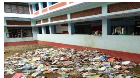
désastre pour la bibliothèque

Le dérèglement climatique a sévi dans le Kerala et des pluies diluviennes ont inondé la région du 16 août au 19 août dernier. En particulier à Angamaly, 170 familles d'élèves ont tout perdu. La boue est montée parfois jusqu'au premier étage des immeubles, engloutissant 6 bus de l'école, détruisant 9000 livres de la bibliothèque. Heureusement pas de morts à l'école. Les professeurs avaient réussi à transporter dans les étages supérieurs le matériel informatique pour le mettre à l'abri.