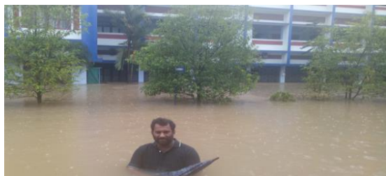
Le principal traverse pour sauver ce qu'il peut