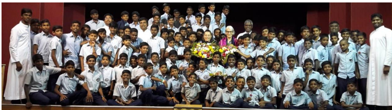
Première soirée : 95 garçons nous ont préparé un spectacle et des couronnes de fleurs